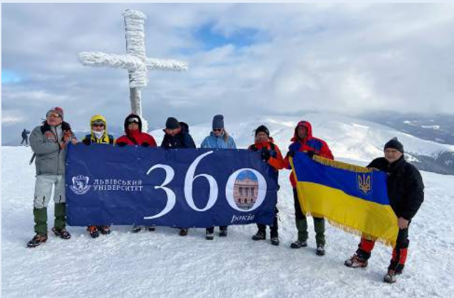
Делегація Університету успішно здійснила сходження на Говерлу. Світлина учасників експедиції