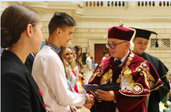
Урочиста посвята першокурсників у студенти Львівського університету.