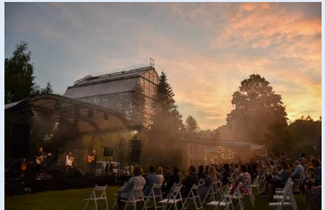
Літній вечір у Ботанічному саду.