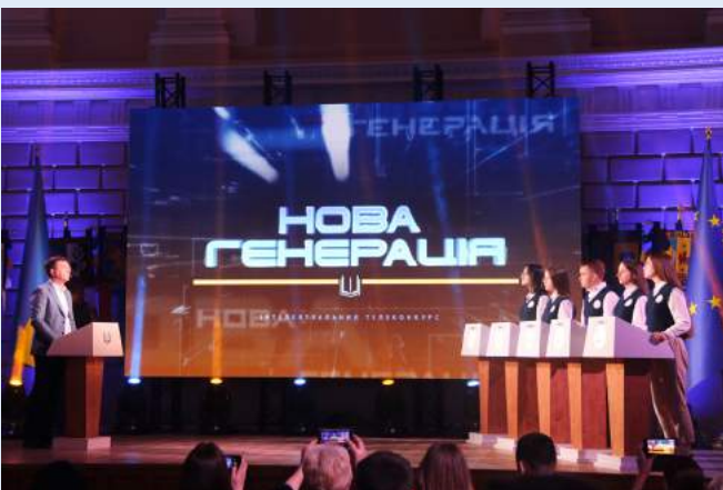
Телепрем'єра ініційованого Львівським університетом просвітницького інтелект-шоу «Нова генерація».