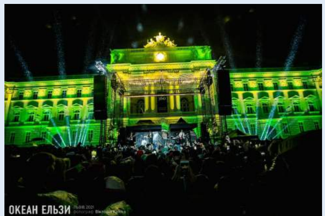
Концерт гурту «Океан Ельзи» з нагоди 360-ліття Львівського університету.