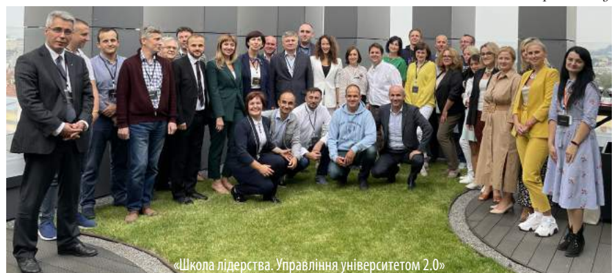
«Школа лідерства. Управління університетом 2.0»

Центр маркетингу та розвитку Світлина Центру маркетингу та розвитку