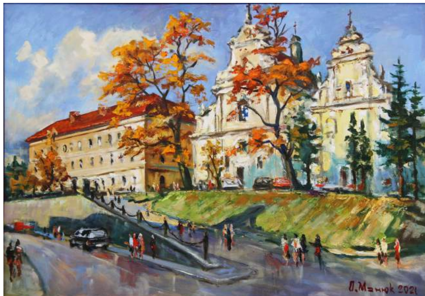
Головний корпус Львівського університету в 1851–1918 рр. Сьогодні - корпус, де розташовані біологічний та геологічний факультети Університету. Картина Ореста Манюка, 2021 р.

Львівський університет вже понад три з половиною століття береже багаторічні академічні традиції національної освіти й науки, водночас формує нові принципи й стандарти сучасної європейської освіти. Університет сьогодні – це історія і класика, розвиток та інновації, відкритість і мобільність, поєднані з академічною відвагою та відповідальністю. До того ж Університет – це неповторні й унікальні особистості, які бережуть його минуле, творять його сучасність і закладають міцне підґрунтя для його перспективного майбутнього.