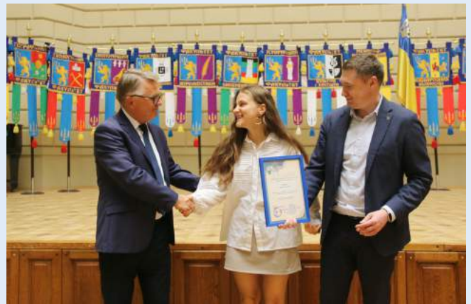
Нагородження учасників ЗНО, які продемонстрували найвищі досягнення.